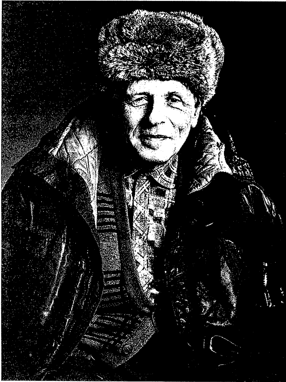
Andrej Sacharow in den 1960er Jahren